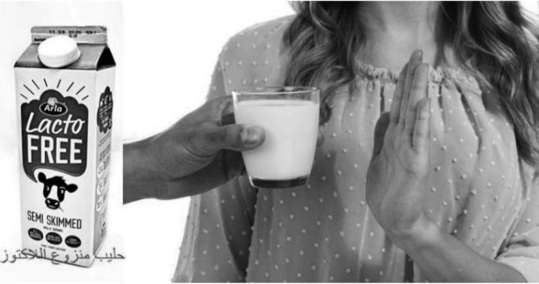
حليب منزوع اللاكتوز

إن منتجات اللاكتيز متوفرة على شكل حبوب وكبسولات وقطرات ومسحوق وبجرعات مختلفة لكي يتناولها المريض قبل تناول الحليب ومشتقاته مباشرة. ويجب ضبط الجرعة التي يحتاجها المريض حسب كمية سكر الحليب التي يتناولها.